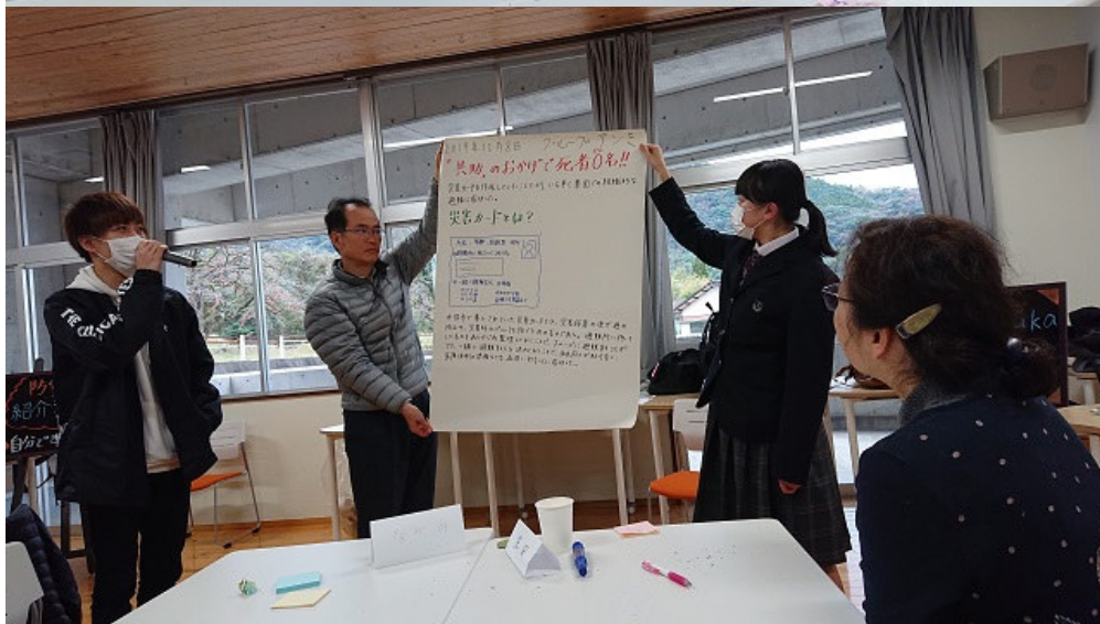
最後まで賑やかにワークショップを行うことができました。 高校生の皆さんには、大学生活の一部を見ていただく機会にもなりました。